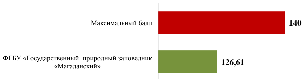
Рис. 1 Результаты опроса пользователей услуг ФГБУ «Государственный природный заповедник «Магаданский», в баллах

Получатели услуги ФГБУ «Государственный природный заповедник «Магаданский» оценили высоко качество предоставляемых услуг (8-9 баллов). Исключение составили критерии, касающиеся обеспеченности условий в организации для лиц с ограниченными возможностями.