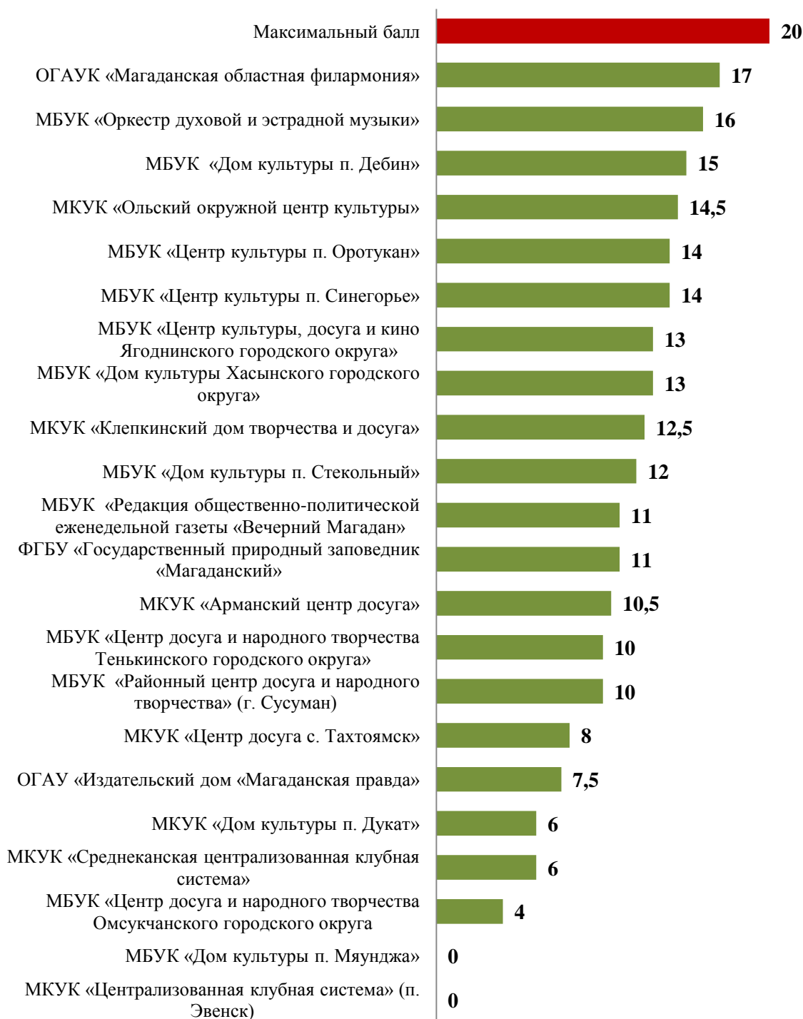
Рис. 5 Результаты независимой оценки уровня открытости и доступности информации на официальном сайте, в баллах