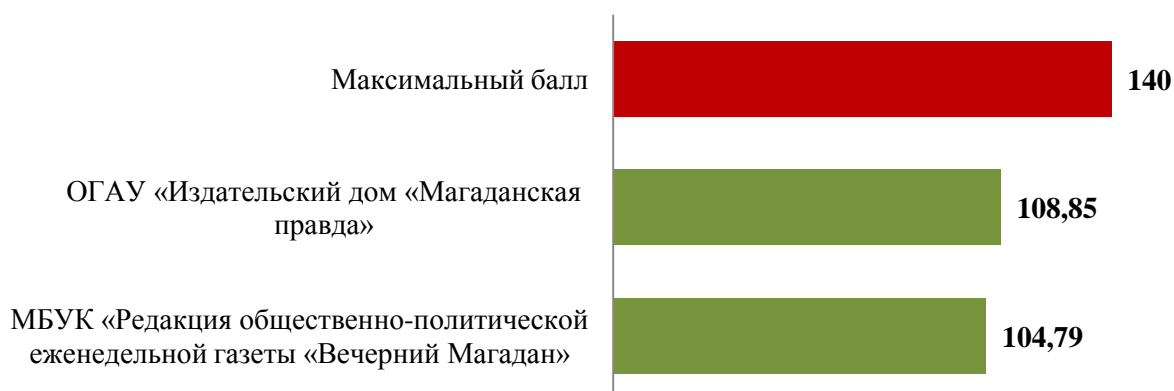
Рис. 2 Результаты опроса пользователей услуг, предоставляемых учреждениями культуры Магаданской области, в баллах (печатные СМИ)

ОГАУ «Издательский дом «Магаданская правда» было оценено пользователями услуг по большинству параметров на 7-8 баллов. Однако относительно ниже был оценен такой показатель, как доступность и актуальность информации о деятельности учреждения на территории данного учреждения (менее 8 баллов). Довольно низко респонденты оценили и созданные в организации условия для лиц с ограниченными возможностями, что является общей тенденцией для многих учреждений культуры.