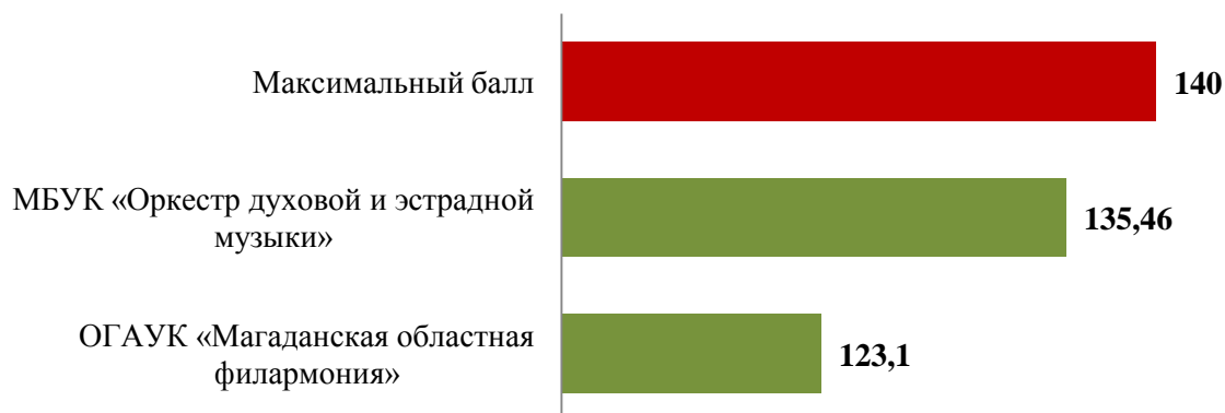
Рис. 3 Результаты опроса пользователей услуг, предоставляемых учреждениями культуры Магаданской области, в баллах (концертные организации)