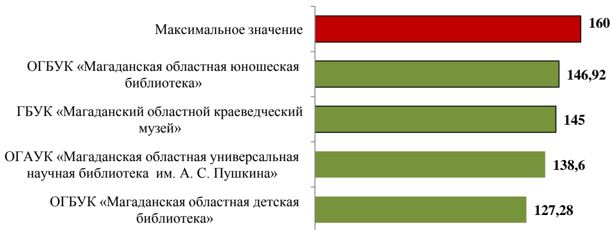
Рис. 3 Результаты независимой оценки качества предоставляемых услуг учреждениями культуры Магаданской области (общие баллы)

По итогам независимой оценки качества условий оказания услуг можно акцентировать внимание на то, что в худшем положении оказались те организации, которые своевременно не отреагировали на требования, предъявляемые к официальным сайтам учреждений культуры.